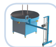
Schlauch auf- und Abroll vorrichtung